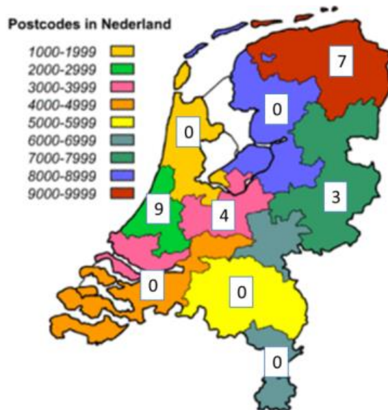
Figuur 1: Verdeling deelnemende scholen over postcodegebieden in Nederland

De deelnemende scholen liggen redelijk verspreid over de Nederlandse postcodes met een goede afspiegeling van Randstad (west), Oost en Noord Nederland en over grotere en minder grote steden (zie Figuur 1).